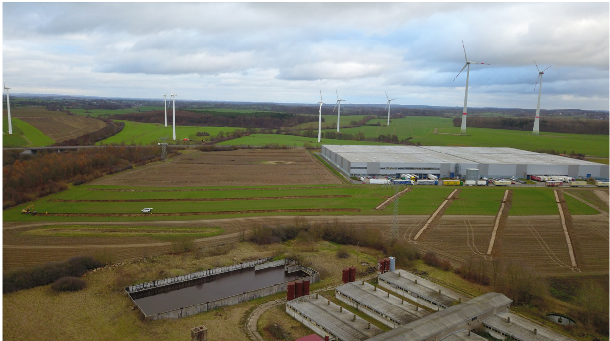
Abb. 2. Suchschnitte im nördlichen Untersuchungsbereich (Foto: C. Unger, LGE).

Die Voruntersuchungen zur Einschätzung der Bodendenkmale wurden zwischen dem 26. November 2018 und 19. Dezember 2018 von drei Mitarbeitern des Landesamtes für Kultur und Denkmalpflege Mecklenburg-Vorpommern, Schwerin, unter Leitung des Verfassers durchgeführt. 1 In dieser Zeit wurden auf dem Fundplatz Schönberg 13 in dem etwa 3 ha großen Baufeld vier Sondageschnitte mit einem Gesamtflächenumfang von 1.963 m 2 geöffnet und 40 archäologische Befunde aufgedeckt.