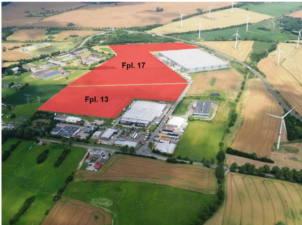
Abb. 1. Lage des B-Planes 12 der Gemeinde Schönberg

Die Stadt Schönberg plant für das Gewerbegebiet „Sabower Höhe“ in der Gemar- kung Schönberg, Lkr. Nordwestmecklenburg, die Erweiterung der Gewerbeflächen (Abb. 1). Bei Prüfung der eingereichten Unterlagen zeigte sich, dass durch das Vor- haben zwei bekannte Bodendenkmäler betroffen waren.