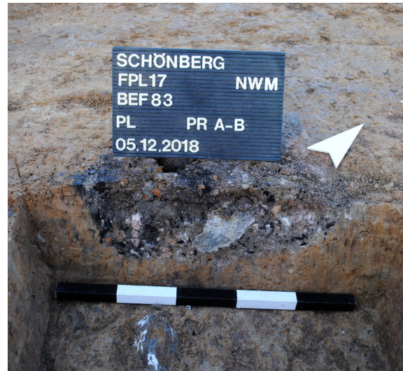
Abb. 7 und 8 Überreste von Herd- und Feuerstellen.