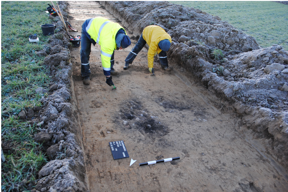
Abb. 3. Flächenfeinputz in einem Suchschnitt.

Die Auswirkungen des sehr trockenen Sommers 2018 erschwerten die Arbeiten. Beim Öffnen der Sondageschnitte hatte selbst der eingesetzte 20-Tonnen Kettenbagger Mühe, den Boden schichtweise abzuziehen. Dementsprechend schwer ließen sich stärker ausgewaschene archäologische Hinterlassenschaften identifizieren. Das Anlegen von Profilkästen per Handschachtung war nur mit größter Kraftanstrengung und Hilfe des Baggers möglich (Abb. 3).