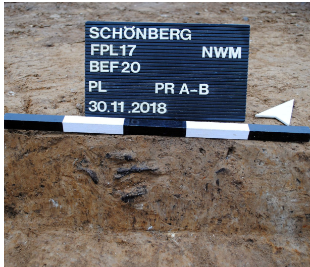
Abb. 5 und 6. Aus einer Pfostengrube wurden Reste von zwei Gefäßen geborgen.