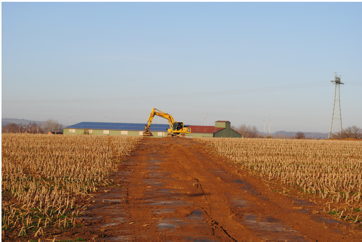
Abb. 4. Verfüllter Suchschnitt nach Abschluss der Untersuchungen.

Die sich auf dem anstehenden Geschiebemergel abzeichnenden Verfärbungen wurden umgehend markiert und in einen Übersichtsplan im Maßstab 1:2500 übertragen, wobei die Nummerierung der Befunde fortlaufend nach ihrer Entdeckung erfolgte. Die Lagekoordinaten wurden mit einem Differential-GPS-Gerät ermittelt. Anschließend wurden die Befundplana bearbeitet, fotografiert und im Maßstab 1:50 gezeichnet. 14 Befunde wurden ausgewählt, um den Erhaltungszustand zu ermitteln. Sie wurden geschnitten und ausgegraben, ihre Profile im Maßstab 1:20 gezeichnet. Nach Abschluss der Dokumentationsarbeiten erfolgte die Wiederauffüllung der Schnitte (Abb. 4).