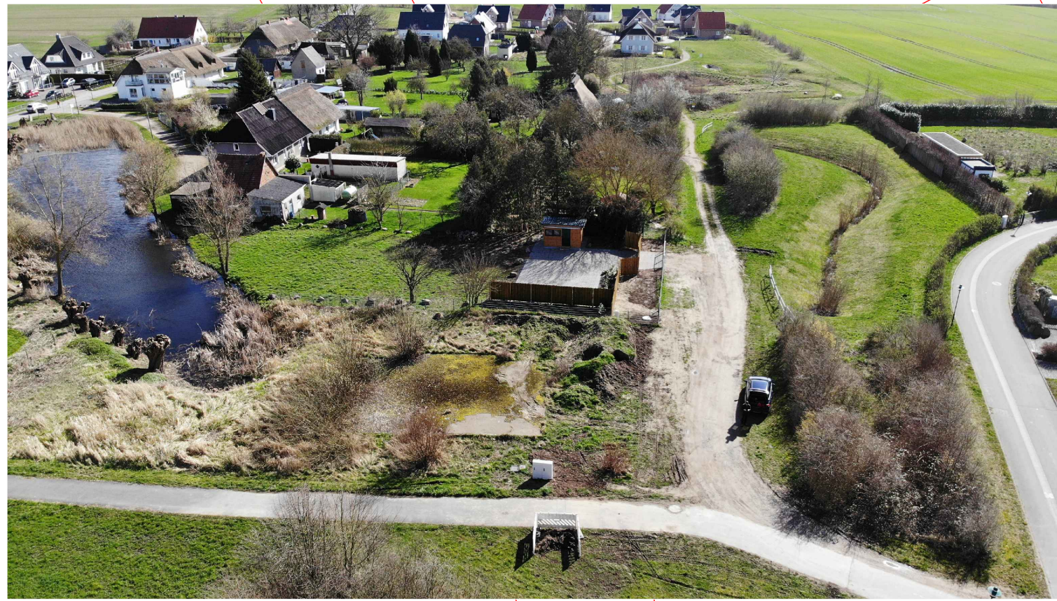
Luftbild 16.03.2024 von Norden