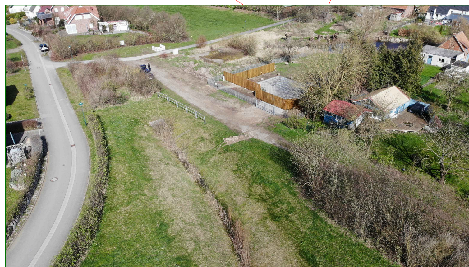
Luftbild 16.03.2024 von Südwesten