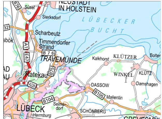
Kartenmaterial: © GeoBasis-DE/MV 2021; © Landesamt für Umwelt, Naturschutz und Geologie Mecklenburg-Vorpommern